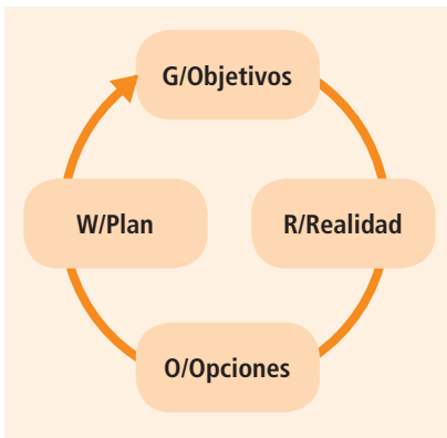
Cuadro 2. Pasos que seguir para alcanzar el objetivo

Naturalmente, el modelo no es lineal, más bien estaría representado por una figura circular en